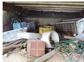
高架下に投棄されたごみ