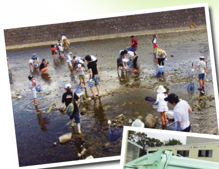
昨年水生生物調査学習会の様子

申し込み 7月4日(木)からの平日8時30分~17時に電話で環境政策課(☎229-3212)へ