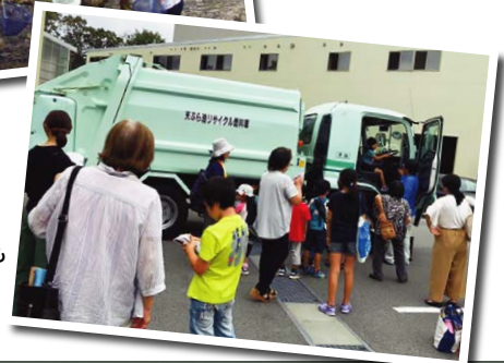
昨年の夏休み子どもごみ教室の様子