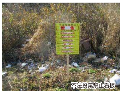
不法投棄禁止看板