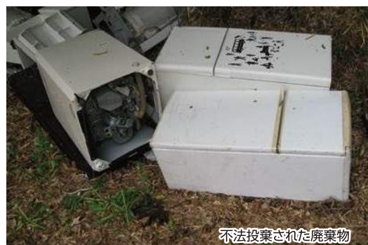
不法投棄された廃棄物