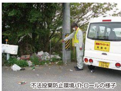
不法投棄防止環境パトロールの様子

しかし、投棄者が不明の場合は土地の所有者(管理者)が自らの責任でごみを処理しなければなりません。土地の所有者(管理者)の皆さんは、不法投棄をされにくい環境にするため、定期的な見回りや、草刈り・剪定、土地の周囲をロープや柵で囲むなど、自己防衛をしましょう。