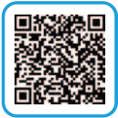
「つながるハンドブック」

障がい福祉課では、こどもの成長・発達に心配がある時、障がいがあると分かった時などに活用していただけるように相談や支援機関を1冊にまとめた『つながるハンドブック』、障がいのある方への支援を詳しく紹介する『障がい福祉のてびき』を作成しています。