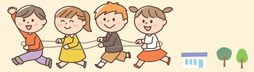
▼久居中央スポーツ公園

令和7年4月から、久居中央スポーツ公園とお城公園を対象に、こどもや子育てに関わるさまざまな立場の人が当事者として参加する「こどもの遊び場づくり事業推進会議」を開始しました。