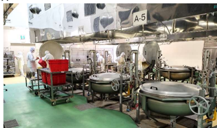
～調理作業の様子～ センターには、12個の回転釜があります。 この釜で、カレーやマーボー豆腐などを作ります。

※給食の材料費は保護者の皆様からの給食費で賄われていますので、ご協力をお願いします。 物資の都合上、献立が変更になることがあります。ご了承ください。