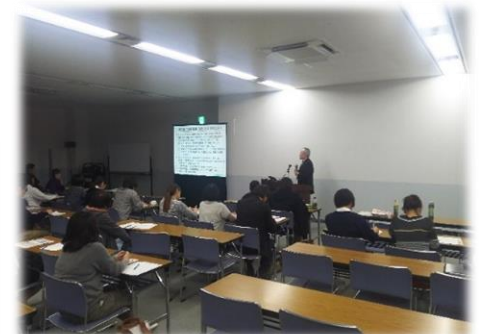
多職種協働認知症対応 力向上研修 開催