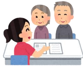
認知症初期集中支援 チームなどとの連携