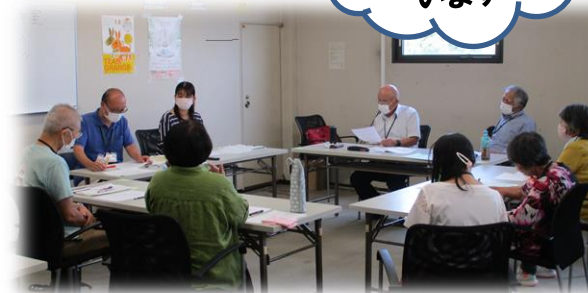
チームオレンジ・あしたば開催