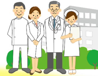
医療機関との連携