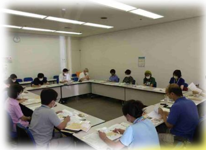
認知症カフェ交流会 開催