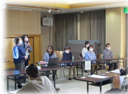
認知症サポーターステップアップ講座での 本人発信支援