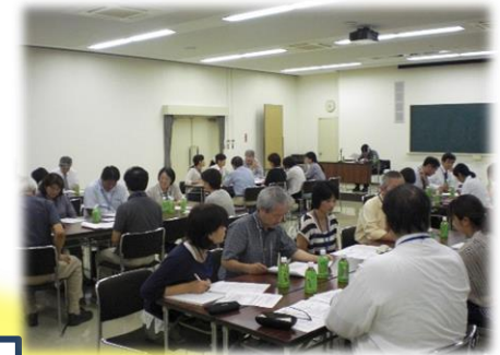
認知症疾患医療センター 事例相談会 参加