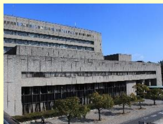
大規模改修が進む本庁舎