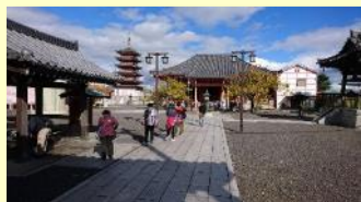
津のまん中ウォーク