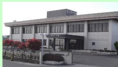
勤労者福祉センター(サンワーク津)