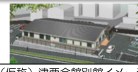
(仮称)津西会館別館イメージ