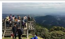
経ヶ峰ハイキング

地域住民が考える地域のあり方を踏まえ、各地域の特性や資源を活かした個性が輝く地域づくりを行います。