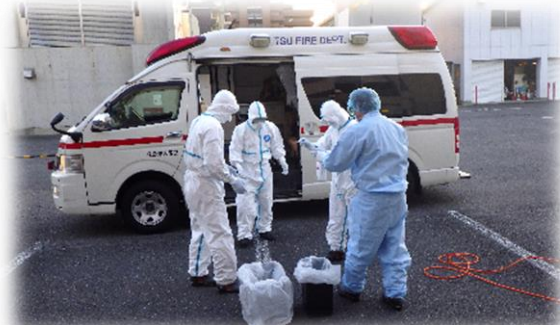
新型コロナウイルス感染症救急業務後の消毒作業