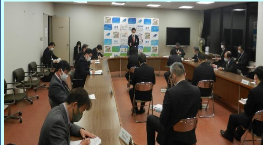
津市新型コロナウイルス感染症対策本部会議