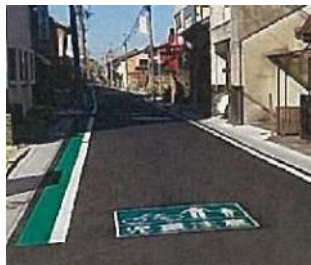
【通学路等安全対策事業のイメージ】