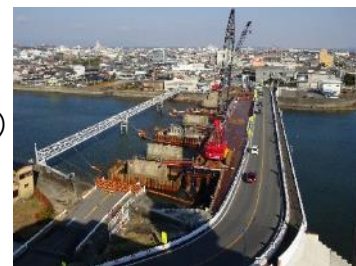
【架け替え中の津興橋】