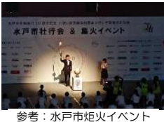
参考：水戸市炬火イベント

各種媒体による情報発信により機運の醸成を図るとともに、炬火イベントによる出場選手への激励、ボランティアの団結等により、関係者が一体となった国体・大会を創出します。