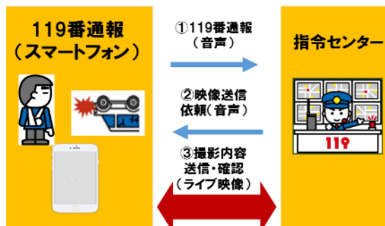
映像通報システムのイメージ