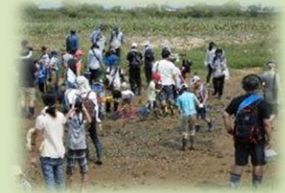
干潟の生き物観察会