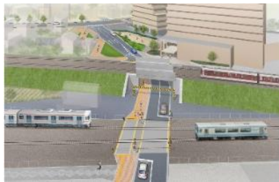
【拡幅後の大谷踏切イメージ図】