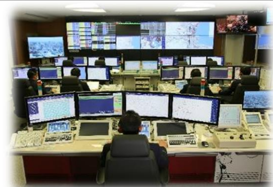
現在、運用中の消防指令センター