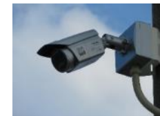
防犯カメラ設置補助事業