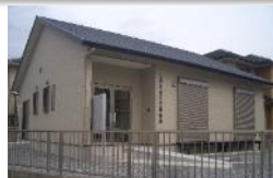
集会所建築等補助金活用事例