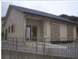
集会所建築等 補助金活用事例