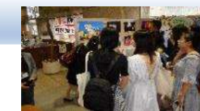
鎮江市（中国）との交流事業