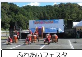
ふれあいフェスタ