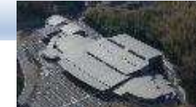
斎場「いつくしみの杜」