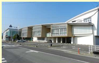
照明器具LED化を行う安濃庁舎及び香良洲庁舎