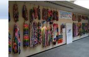
平和を考える市民のつどい