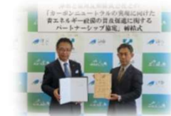
パートナ シップ協定 締結式