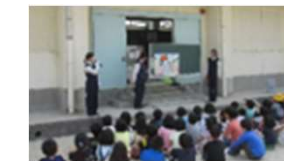
小学校での交通安全教室