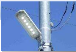
防犯灯設置補助事業