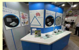
販路拡大支援(展示会)