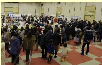
スイーツフェスタ