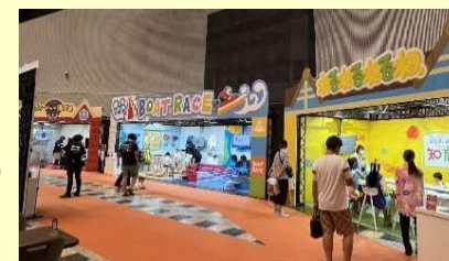
令和6年度のイベントの様子