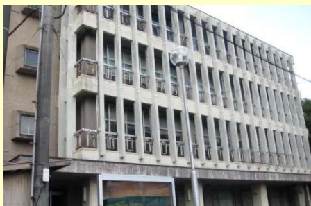
除却を行う旧社会福祉センター