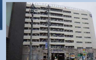
市営アスト駐車場

収益的支出 196,116千円 市営駐車場(4駐車場)の管理・運営 資本的支出 193,028千円 建設改良費、他会計借入金償還金等