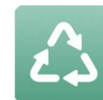
ごみ分別アプリ 配信中