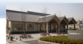
高茶屋市民センター