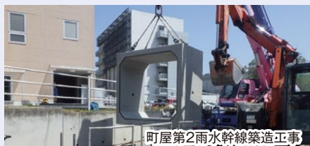
町屋第2雨水幹線築造工事