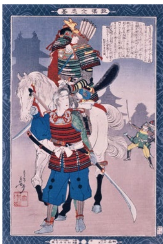
安濃津城籠城戦之図

津に戻った信高 は、伊勢上野城主の 分部光嘉や津の町の 住民と共に城に立て こもりました。これ が関ヶ原の戦いの前 哨戦である「安濃津 城籠城戦」です。西 軍3万余の軍勢に対 し、2,000人に満た ない軍勢での戦い は、四方からの激し い攻撃に耐えながら