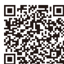
申し込み フォーム