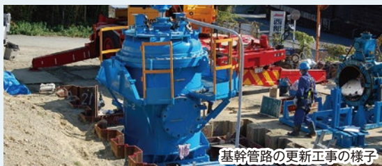
基幹管路の更新工事の様子

基幹管路とは、浄水場や配水池に水を送る管と各家庭に水を送る配水管の中でも、口径の大きい管のことだよ。