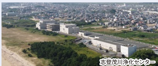
志登茂川浄化センター

供用開始が遅れた志登茂川処理区(旧津市北部・河芸・安濃地域を受け持つ処理区)の重点化区域を中心に整備を進めます。