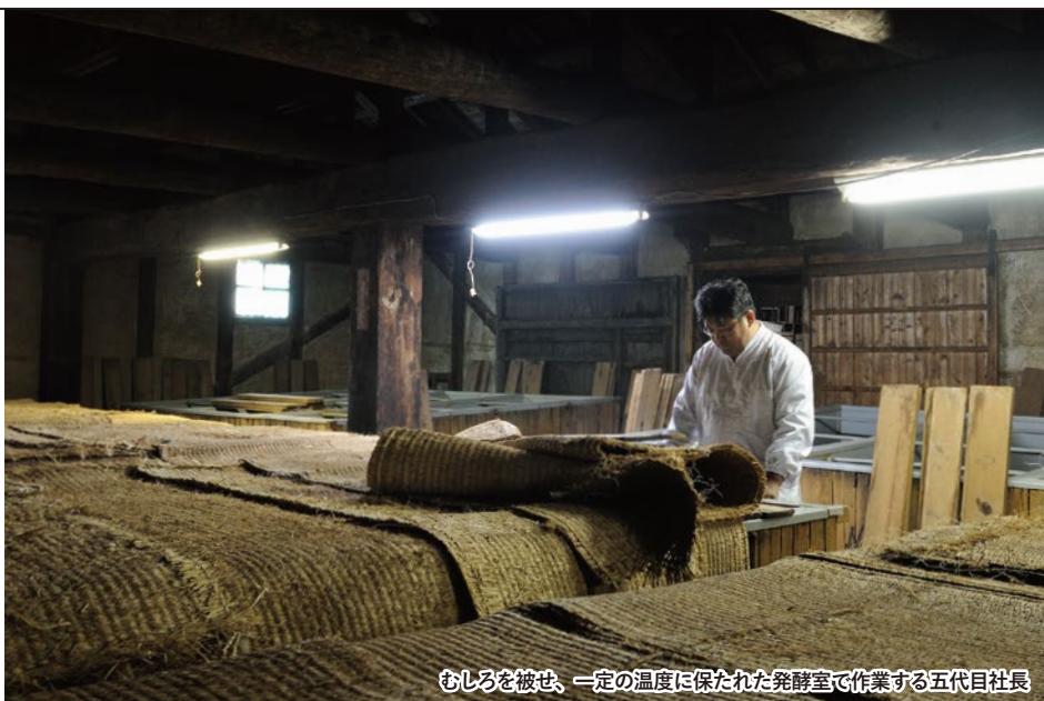
むしろを被せ、一定の温度に保たれた発酵室で作業する五代目社長