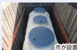
市が設置した浄化槽

生活排水処理の適切な役割分担により、集合処理が非効率な地域は市営浄化槽事業を行っています。