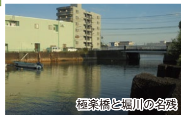
極楽橋と堀川の名残