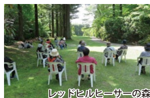
レッドヒルヒーサーの森