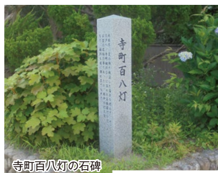
寺町百八灯の石碑

寺町百八灯は、第二次世界大戦中の灯火規制により廃止されるまで、この地域のお盆の風物詩として行われていました。堀川は昭和39年に埋め立てられ、現在は岩田川沿いの北側に架かる極楽橋付近にわずかに昔の面影を残しています。寺町百八灯も忘れられたものとなり、極楽橋中継ポンプ場入口に設置した石碑にその由来が記されるのみとなっています。