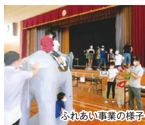
ふれあい事業の様子

また、地域で培われてきた食文化である“とりめし”の歴史を一冊にまとめ、各家庭に配布しました。その他、敬老会、環境美化事業、楽しくサロン、下校時の見守り、地域づくり事業など、地域の皆さんが楽しく交流ができる居場所づくりを提供するため、さまざまな活動を行っています。