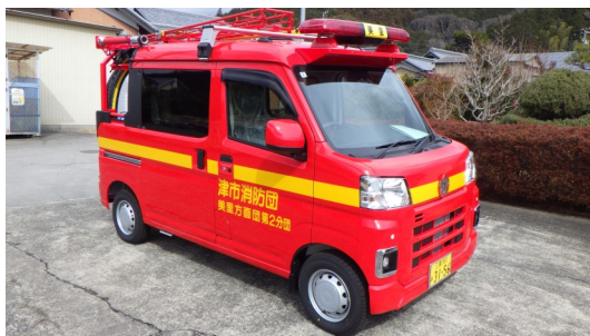
第2分団ポンプ積載車