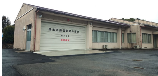
第3分団車庫・詰所