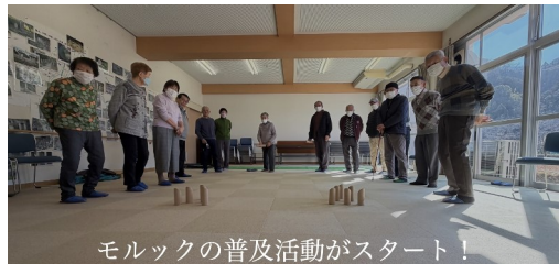
モルックの普及活動がスタート！

そのほかにも、例えば「美杉町のファン(関係人口)を増やすための観光ツーリズムの仕組みづくり」「ローカルラジオ局の開設」など、ユニークな取り組みも考案中です。いずれにしても現在進行中の取り組みの数々はいつかきっと美杉の明るい未来につながる…そう信じて挑み続けていこうと思っています。