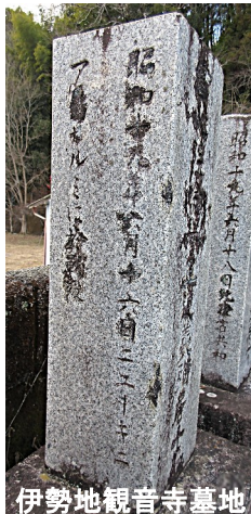
伊勢地観音寺墓地

西部ニューギニアでの戦いはあまり知られていませんが、ここでも激しい戦闘がありました。病死・餓死も多く、サルミ地区に上陸した第36師団の生存率は約3割でした。(津市石造物調査会)