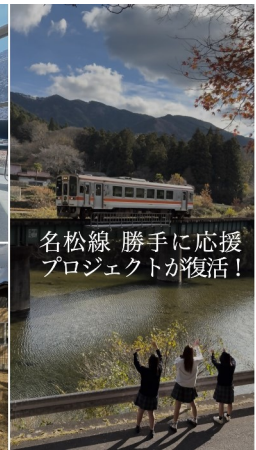
名松線 勝手に応援プロジェクトが復活！