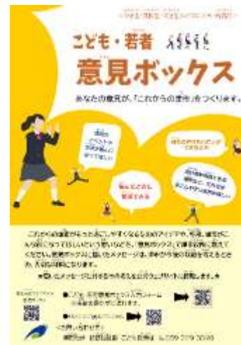
(中高生、大学生、若者用)