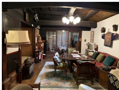
【リビング・ダイニング】