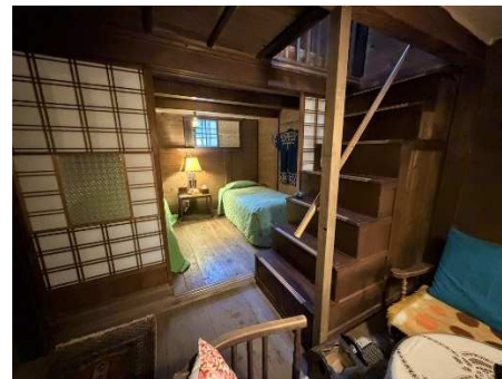
【蔵1階 ゲスト用寝室】