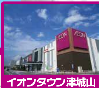
イオンタウン津城山

駐車場が混雑することが予想されます。バスでお越しの場合は、JR・近鉄津駅の東口より「津駅前」バス乗り場1番にて「警察学校」行きに乗り、約25分。最寄りの停留所は「城山北」。 注)「城山北」に停留しない場合は「中城山」または「城山西」にて下車してください。1時間に約2本運行。