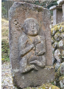
※錫杖と宝珠を持つことから地蔵菩薩と判断される(杉平永昌寺墓地)

石仏に限らず、仏像には造立の背景や目的があり、それを知ることは歴史を紐解く上で有益です。石仏に造立趣旨の刻銘がある例は稀で、外形的特長から類推することになります。仏さまのお姿や祀り方には経典などに定められた約束ごと(儀軌)があります。六道輪廻の衆生を救済する地蔵菩薩は錫杖と宝珠を持つ僧形、極楽浄土の教主、阿弥陀如来は頭頂に肉髻があり来迎印を結ぶというように、お姿や持物、印相などの特長から尊格の特定ができるのです。細部表現が簡略化され、苔生して風化が進む石仏の特長を見出すのに苦労することもあります。儀軌などの予備知識を元に造立の背景を推しはかることは、調査の大切なポイントだと言えるでしょう。 (津市石造物調査会)