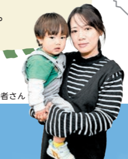
鈴鹿市からの利用者さん

市外からも通いやすく、新鮮な野菜やお肉が手に入るので、日々の買い物に利用しています。レストランでおいしいご飯も食べられ、家族で楽しめるのも嬉しいです。