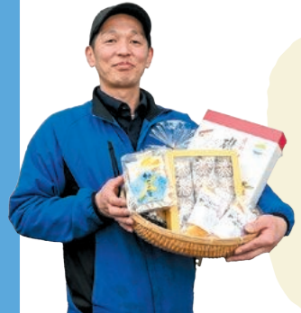
道の駅津かわげ 駅長さん