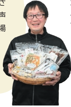
水産加工業者さん

うれしいのは、道の駅に商品を持ち込んだとき、お客さんから「おいしかったよ」と声をかけてもらえること。市場出荷では見えない食べる人の笑顔が励みです。津の海の魅力を私たちの手で届けていきます。