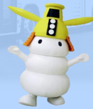
シロモチくん （津市）