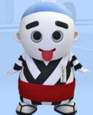
こにゅうどうくん （四日市市）