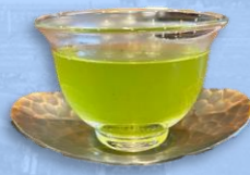
かぶせ茶 （四日市市）