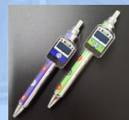
ボールペン （四日市あすなろう鉄道）