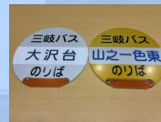
バス停看板 （三岐バス）