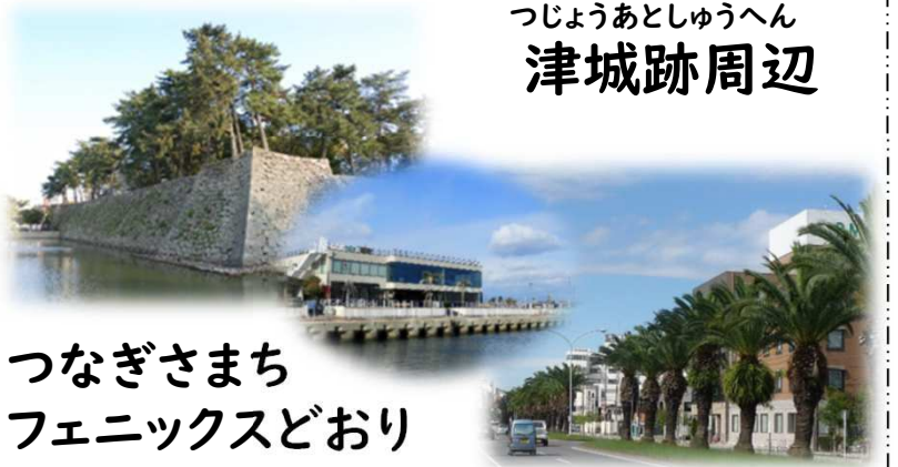
つなぎさまち フェニックスどおり