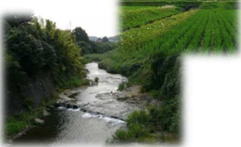
さかきばらおんせん 榊原温泉