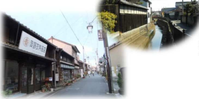
いっしんでん 一身田