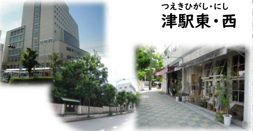
つえきひがし・にし 津駅東・西