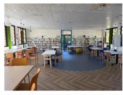
⑥多目的室 （職員の会議室でもあります。）