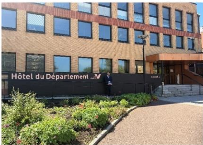
①ヴァルドワーズ県庁舎 （行政の建物という感じはせず、大学のキャンパスのような印象を受けました。）

まるで大学のキャンパスのようなモダンな建物で、広々とした空間・敷地が印象的でした（写真②、③）。執務室は個人部屋があり、広々とした空間に自然光が差し込む会議スペースもありました。壁には、職員同士の写真やその月に誕生日を迎える職員の名前が掲示されており、組織としての一体感や職員間の距離の近さを感じられました。庁舎内には、職員用のトレーニングルームや気軽に談笑できるリクリエーションルームなども整備されていました（写真④、⑤、⑥）。