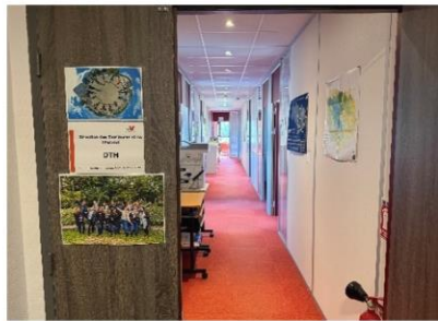
②執務室 （広々としたスペースや職員の写真が掲載されていることが印象的でした。）