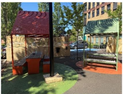
④県庁敷地内屋外交流スペース （職員間の会話も弾みそうです。）