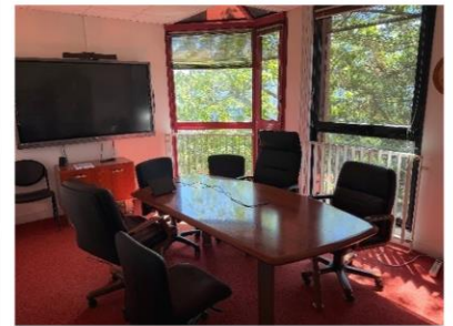
③会議室 （ゆったりとしたスペースで大きい窓も設けられ、リラックスした雰囲気でした。）