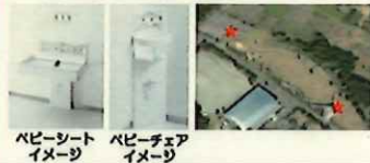
ベビーシート イメージ ベビーチェア イメージ