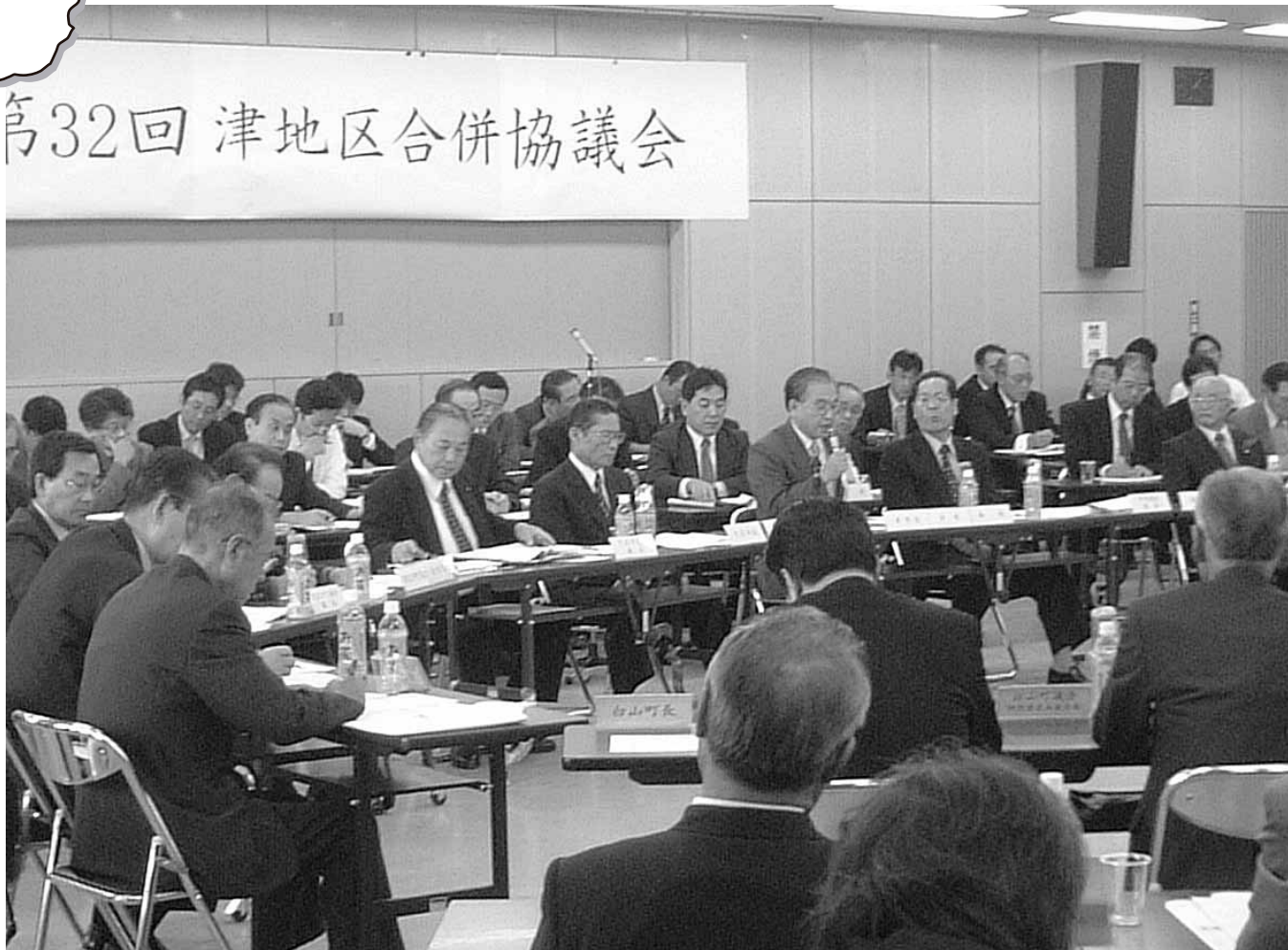
合併の期日について議論が交わされる（津市役所大会議室）