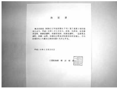
県知事からの決定書