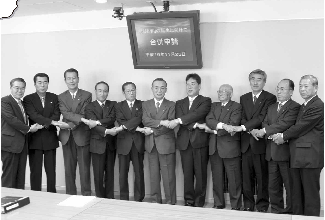
申請を終え県知事へ交えて握手(県庁)