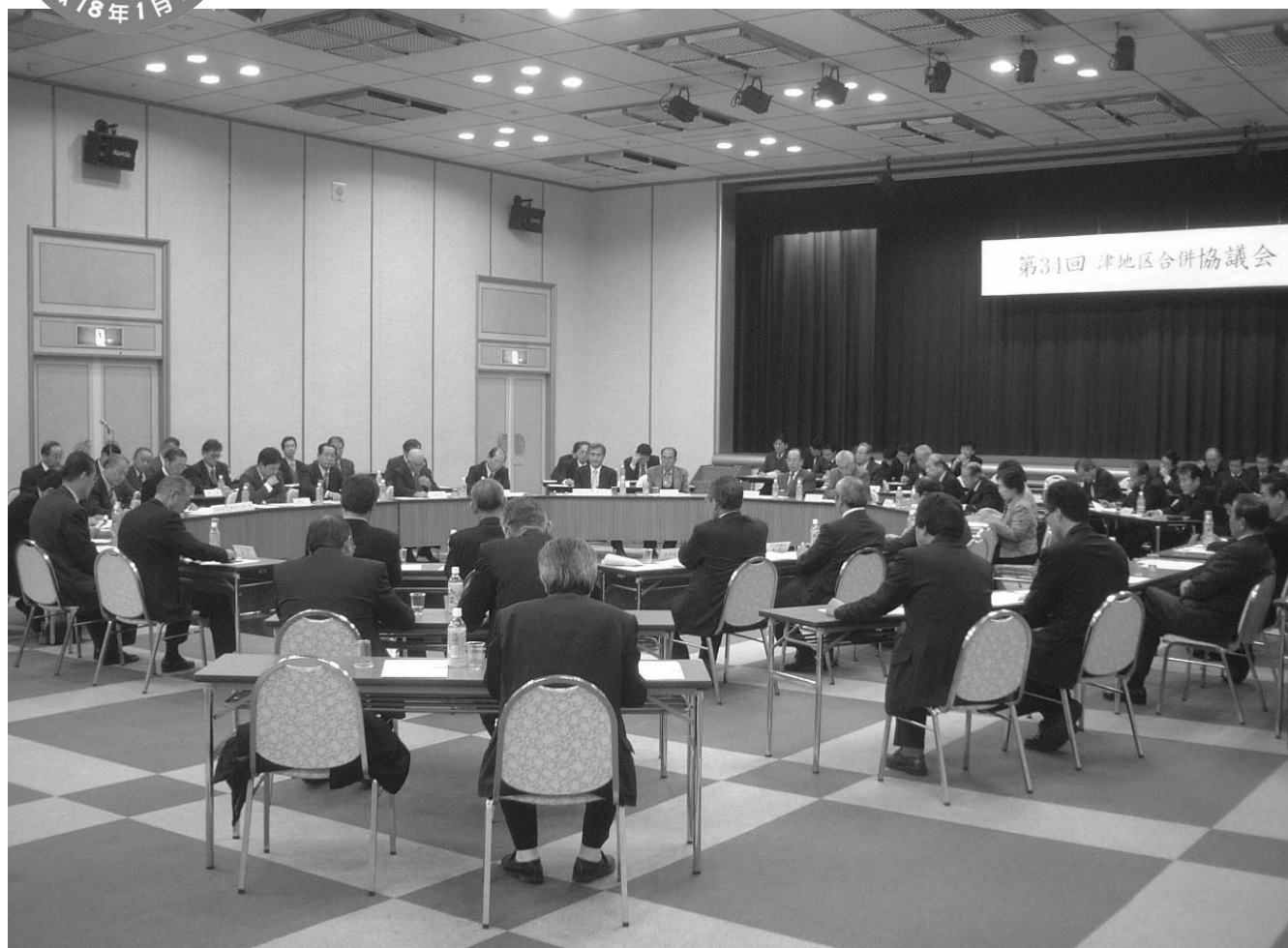
告示後初めての合併協議会（津市センターパレスホール）

平成17年3月1日 ● 津地区合併協議会 ● ☎059(229)3450 ● FAX059(229)3451