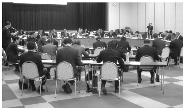
協議会の議事の様子