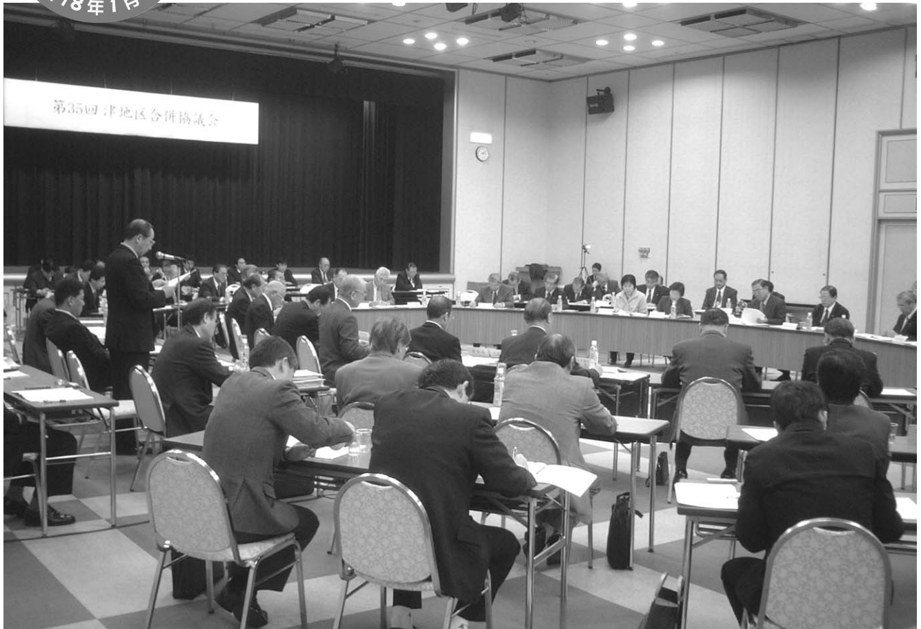
第35回協議会の様子（津市センターパレスホール）

平成17年4月1日 ● 津地区合併協議会 ● ☎059(229)3450 ● FAX059(229)3451