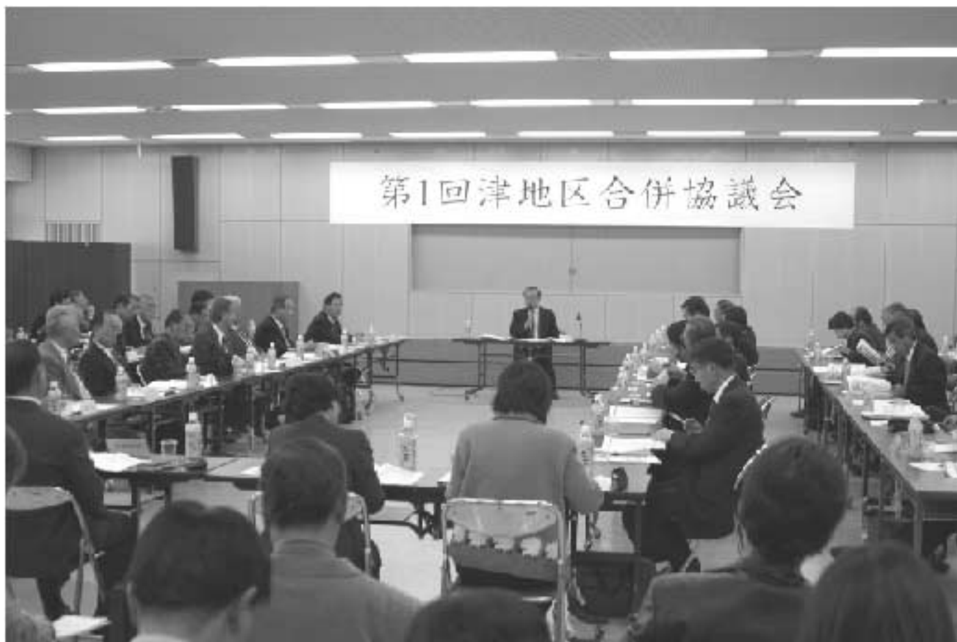
津地区合併協議会での協議の様子