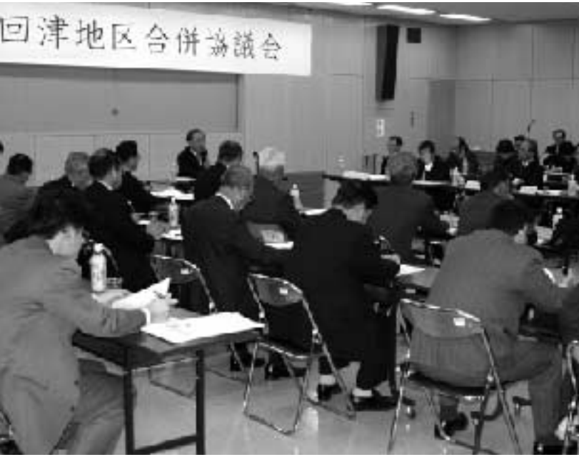
議長による議事進行

2月18日に津市役所8階大会議室で開かれた第1回津地区合併協議会で、協議された事項とその結果は次のとおりでした。