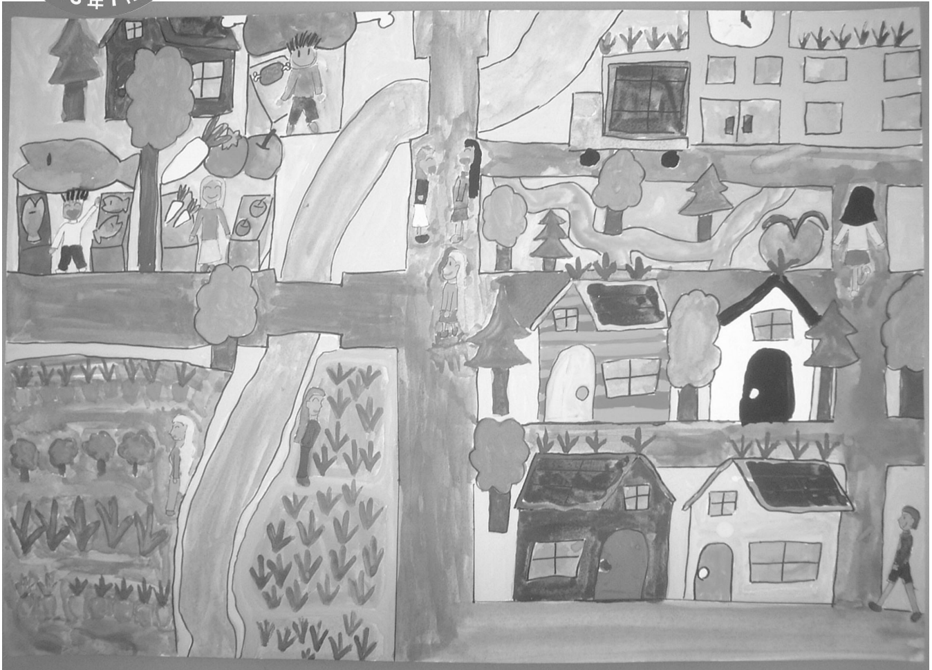
「津市の夢～未来の絵」最優秀賞作品

平成17年11月1日 ● 津地区合併協議会 ● ☎059 (229) 3450 ● FAX059 (229) 3451