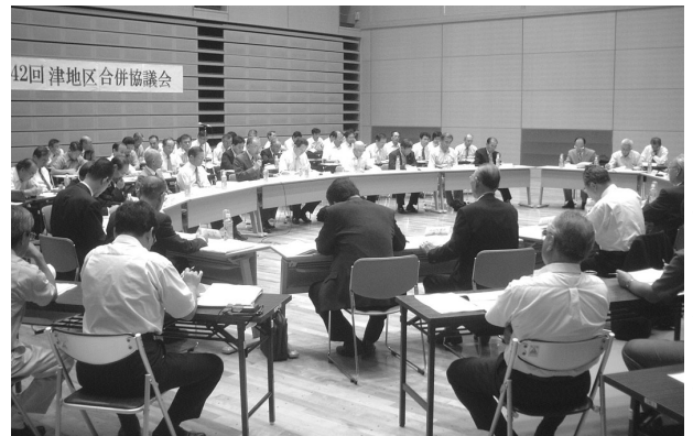
大詰めを迎える協議