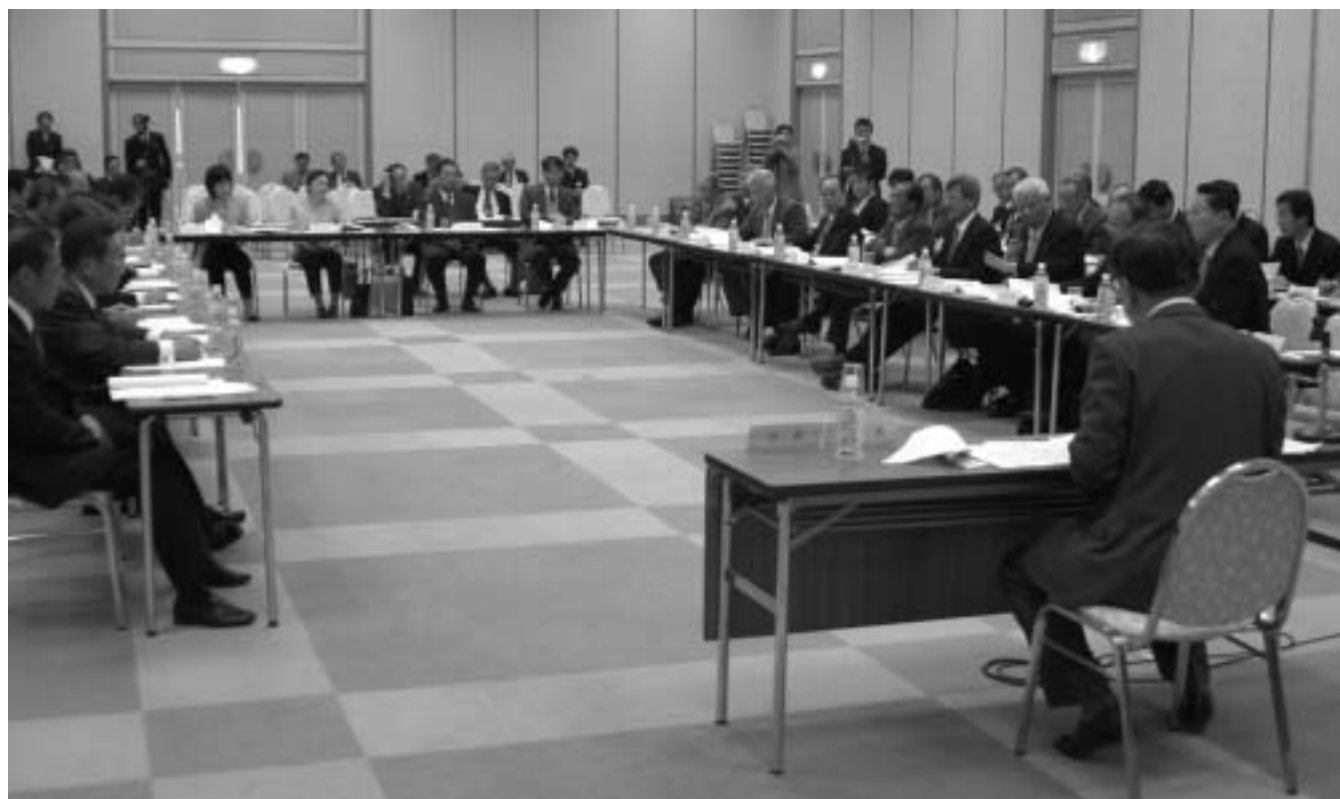
活発な議論が交わされた第2回の協議会