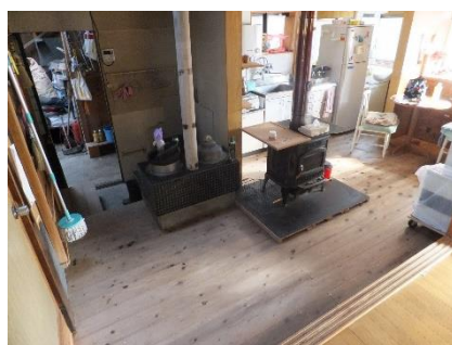
【台所 (かまど、薪ストーブ)】