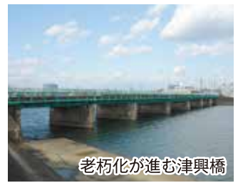
老朽化が進む津興橋

市民生活のご不便を解消し、安心してご利用いただけるよう、道路、堤防、下水道など社会基盤の整備を進めます。津駅北の大谷踏切の拡幅事業に着手したのに続き、通称近鉄道路の津興橋の架け替えを決定しました。