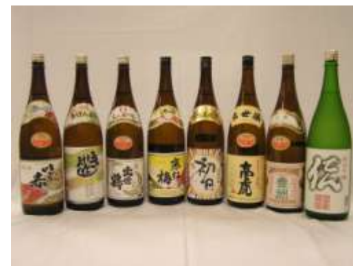
日本酒をはじめとした醸造蔵 味くらべ展も検討