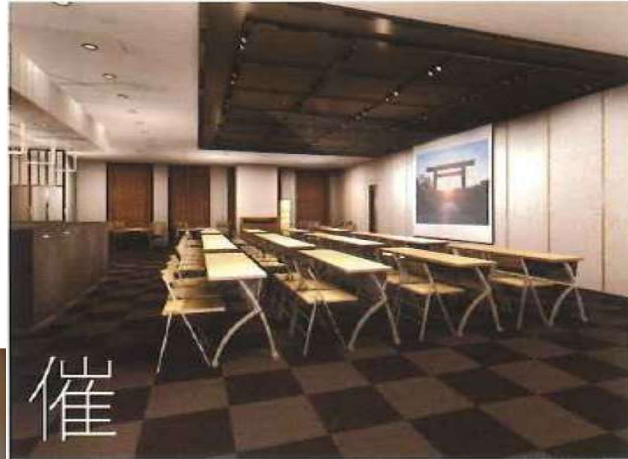
多目的ホールイメージ図