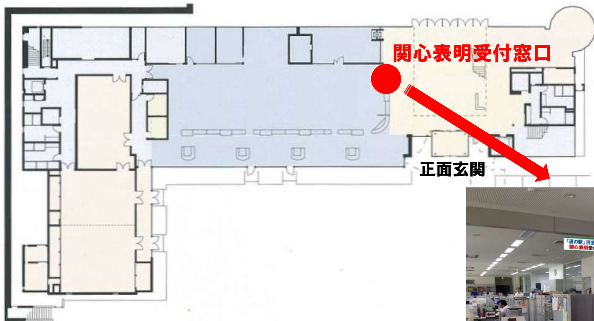
市河芸庁舎1階フロア図