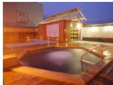
榊原温泉郷の紹介!!