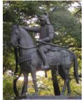
藤堂高虎と 津城展