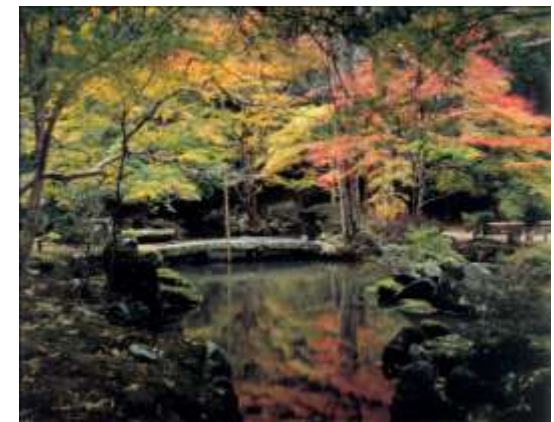
北畠氏ゆかりの展示や 霧山城址の薪能も紹介