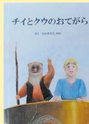
チイとクウのおてがら