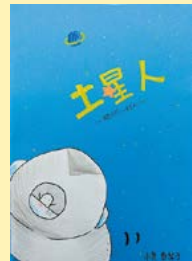
土星人~地球へ行く~