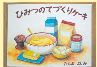
ひみつのてづくりケーキ