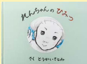
れんちゃんのひみつ