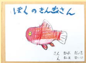
ぼくのきんぎょさん