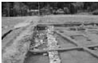
多気北畠氏遺跡発掘調査