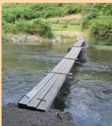
流れ橋 (美杉町奥津)

と狭く、車一台がようやく渡ることのできる程度です。ここから約1km下流の其倉橋もかつては潜水橋でしたが、昭和60年に現在の橋に架け替えられました。