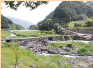
真見潜水橋 (白山町真見)