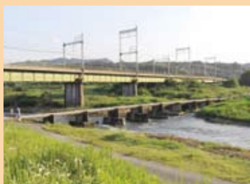
石橋潜水橋 (一志町石橋)

雲出川水系の潜水橋の中で最も下流にあり、最大規模を誇るのが石橋潜水橋です。この橋の長さは168mですが、幅は2・8m