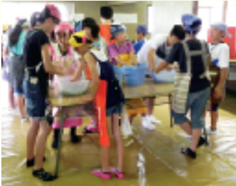
昨年のこんにやく作り体験の様子

400年以上もの歴史があるといわれている一身田の寺内町で、歴史や文化に触れ、さまざまな手作り体験・食体験などを楽しみましょう。 とき 8月22日(月)13時30分～24日(水)15時 ※2泊3日 宿泊場所 高田本山専修寺宿坊(一身田町) 内容 和本作り、昔の遊びの体験、寺内町散策、和菓子・こんにやく作り体験、寺内町調べ活動など 対象 小学5・6年生 定員 先着70人 参加費 9,000円 申し込み はがき(1人1枚)に「歴史まるごと体験塾」と明記の上、住所、児童と保護者の氏名、電話番号、学校名、学年を記入し、〒514-8611 住所不要 教委生涯学習課へ 申込期間 7月8日(金)～20日(水) 消印有効 問い合わせ 教委生涯学習課 ☎229-3251 📠229-3257