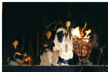
昨年の津市民新能