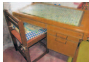
学習机…幅110cm、奥行き60cm、高さ52～73cm、椅子付、無料