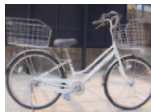
自転車…24インチ、自動LEDライト付、3段変速、使用1回のみ、8,000円