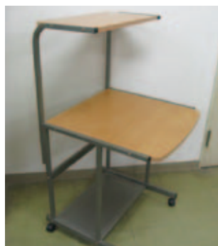
パソコンデスク…幅60cm、奥行き60cm、高さ113cm、無料

現在掲示板にある情報の一部を紹介します。ただし、6月10日現在の情報のため、すでに受け渡し完了している場合があります。