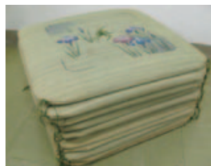
いぐさ座布団10枚…無料