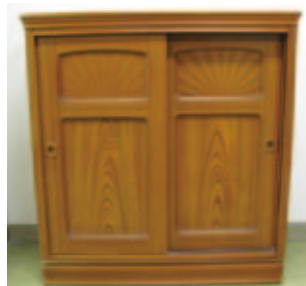
げた箱…幅89cm、奥行き42.5cm、高さ95cm、無料