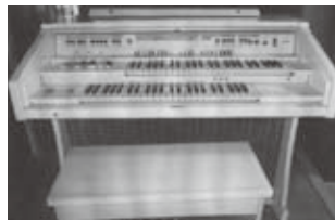
①電子オルガン…幅120cm、奥行70cm、高さ100cm、無料

現在掲示板にある情報の一部を紹介します。ただし、5月10日現在の情報のため、すでに受け渡し完了している場合があります。