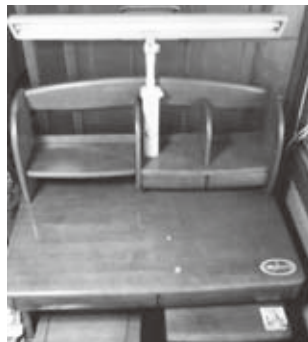
③学習机…幅100cm、奥行65cm、高さ110cm、無料