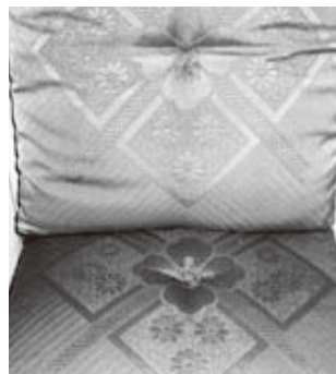
②客用座布団3枚セット…少々日焼け有り、無料