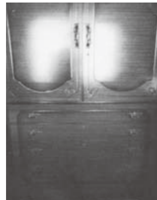
④和だんす…幅115cm、奥行43.5cm、高さ178.5cm、無料