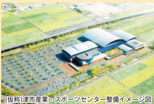
(仮称)津市産業・スポーツセンター整備イメージ図