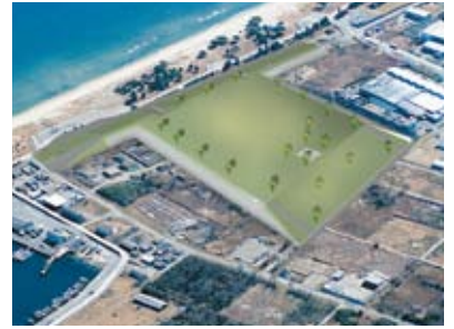
香良洲高台防災公園整備イメージ図