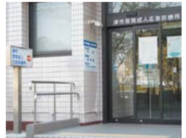
現在の津市夜間成人応急診療所