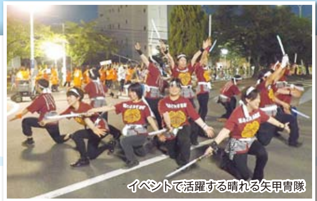
イベントで活躍する晴れる矢甲冑隊

今日も楽しく、まちを元気にするきっかけづくりをする三重ドリームクラブの周りには、いつも笑顔があふれています。