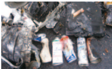
▲4月2日に発生したごみ収集車の火災