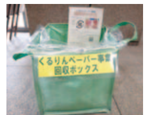
くるりんペーパー事業回収ボックス