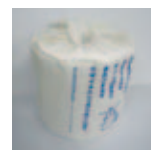
リサイクルされたトイレットペーパー