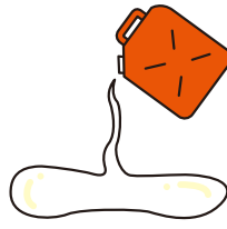
オイル・灯油など