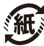
紙リサイクルマーク