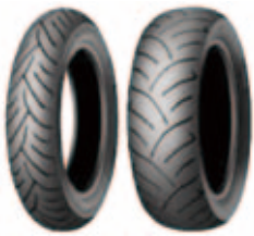
自動車・バイクのタイヤ

下記の処理困難物、危険物は市では収集を行いません。これらを捨てるときは、販売店や専門の処理業者に相談してください。