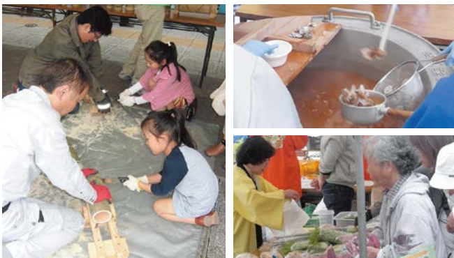
昨年の農林水産まつり