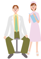
平成24年度津市がん検診精密検査受診率

下のグラフは平成24年度のがん検診の精密検査受診率ですが、大腸がんは50%と低くなっています。大腸がんは早期に発見し治療できれば、治癒する可能性も高くなります。「自覚症状がないから大丈夫」「忙しい」「怖い」と言わず、必ず詳しい検査を受けましょう。