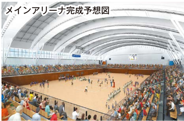
メインアリーナ完成予想図