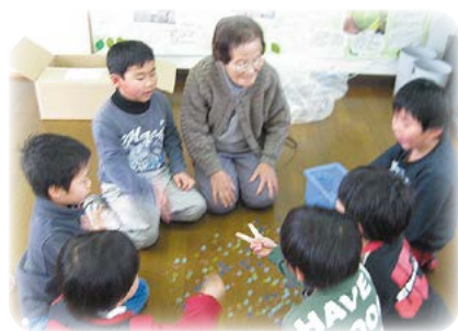
地域の皆さんとの触れ合い

この取り組みは、文部科学省の「人権教育の指導方法等の在り方について[第三次とりまとめ]」