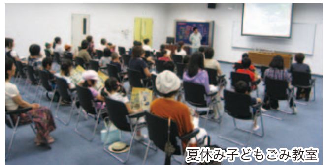
夏休み子どもごみ教室