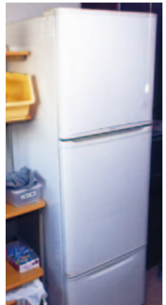
冷蔵庫…無料 (幅57cm・高さ170cm・奥行66cm、ドアに少しへこみ有り)