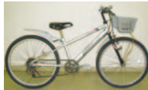
子供用自転車…無料 (24インチ、6段ギア付き)