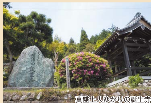
真盛上人ゆかりの誕生寺

問い合わせ 文化振興課 ☎229-3250 ☎229-3247(当日6時30分からは☎080-1577-4649)