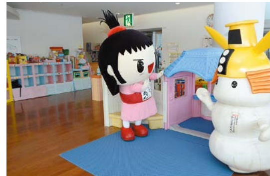
女性子どもルーム