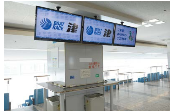
場内の大型液晶モニター