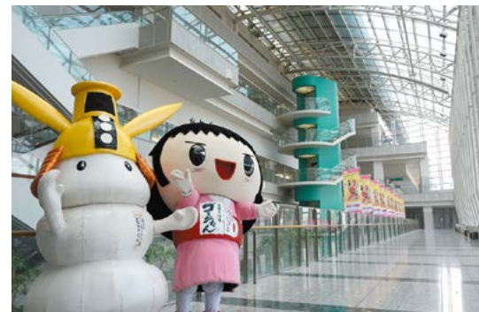
吹き抜けのエントランス