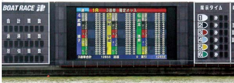
スタンド棟対岸の682インチ大型映像装置

そうだね。若い世代のファンもどんどん増えてきているし、レース以外にもいろいろなイベントをしているから、きれいになったボートレース津に家族で気軽に遊びに来てほしいな。