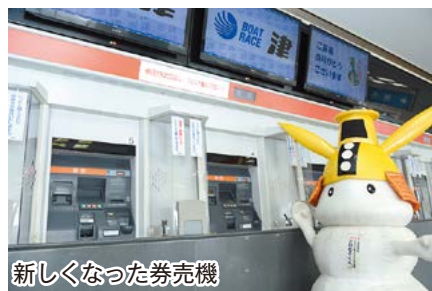
新しくなった券売機

スタンド棟対岸の大型映像装置や館内の映像設備、券売機を15億円ほどかけて新しくして、設備投資を思い切って実行する「攻めの経営姿勢」に変えたんだ。